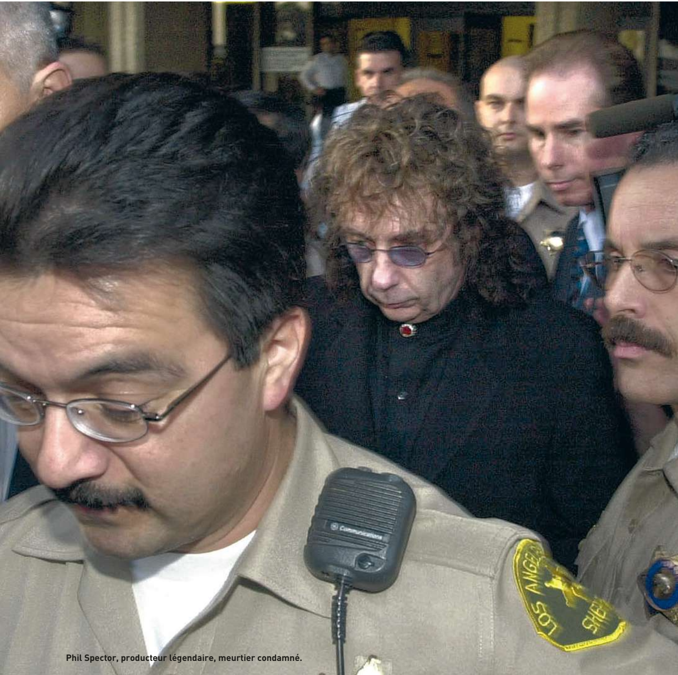
Phil Spector, producteur légendaire, meurtier condamné.