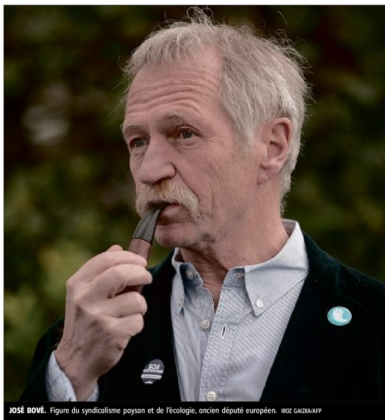
JOSÉ BOVÉ. Figure du syndicalisme paysan et de l'écologie, ancien député européen.

■ Le système de location de terres mis en place est-il suffisamment attractif ? On a fait le choix du fermage et du bail de carrière, qui court jusqu'à la retraite. Être locataire, ça crée des conditions économiques bien plus favorables que sur beaucoup d'autres territoires en France. On a montré que c'était possible. On voit bien ailleurs, et notamment dans le Massif